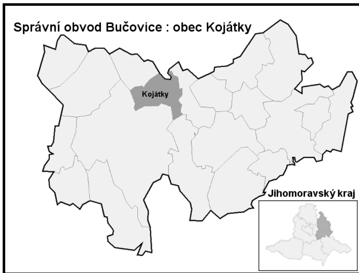
Obrázek 1 Poloha obce na mapě

Kojátky (původní název Kojatka, Kojetice) jsou obec ležící 3 km na severovýchod od města Bučovice. Patří do správního obvodu Bučovice a leží v okrese Vyškov v Jihomoravském kraji. Obec sousedí s katastry Bučovice, Bohaté Málkovice, Kozlany, Nevojice a Milonice. Organizačně jsou Kojátky samostatnou obcí s vlastním obecním úřadem. Úřad s rozšířenou působností je v Bučovicích. Obec má pouze minimální vybavenost. Město Bučovice poskytuje obyvatelům základní vybavenost, vyšší vybavenost poskytují obyvatelům obce Kojátky vedle Bučovic také města Vyškov a Brno, zejména v oblastech správy, školství, zdravotnictví, kultury, sportu, obchodu, služeb, stravování a ubytování. Uvedených center spáduje i dojíždka za zaměstnáním.